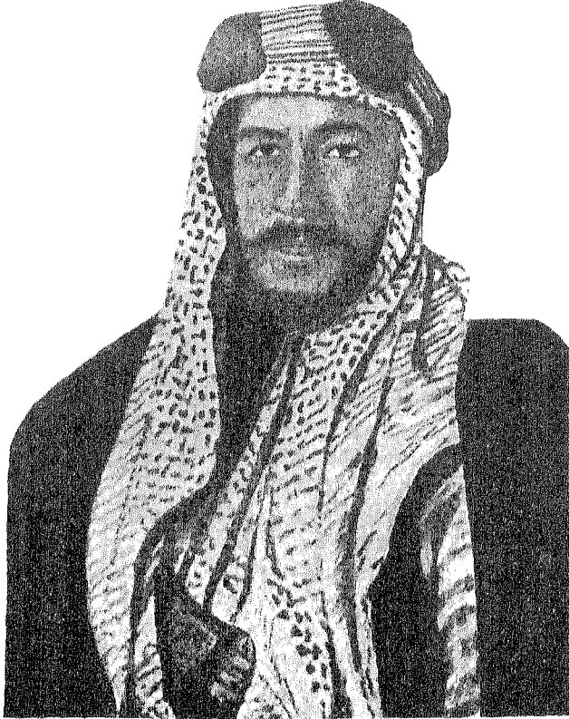
الشيخ مبارك الصباح

ينتمي مبارك بن صباح بن جابر بن عبد الله بن صباح إلى عنزة، من اسد. وكانت أمه لؤلؤة بنت محمد من بني مرخان، جده سعود، الذي ينتسب إليه آل سعود. وكانت أخبار مبارك مع عبد العزيز مليئة بالمفارقات والتناقضات.